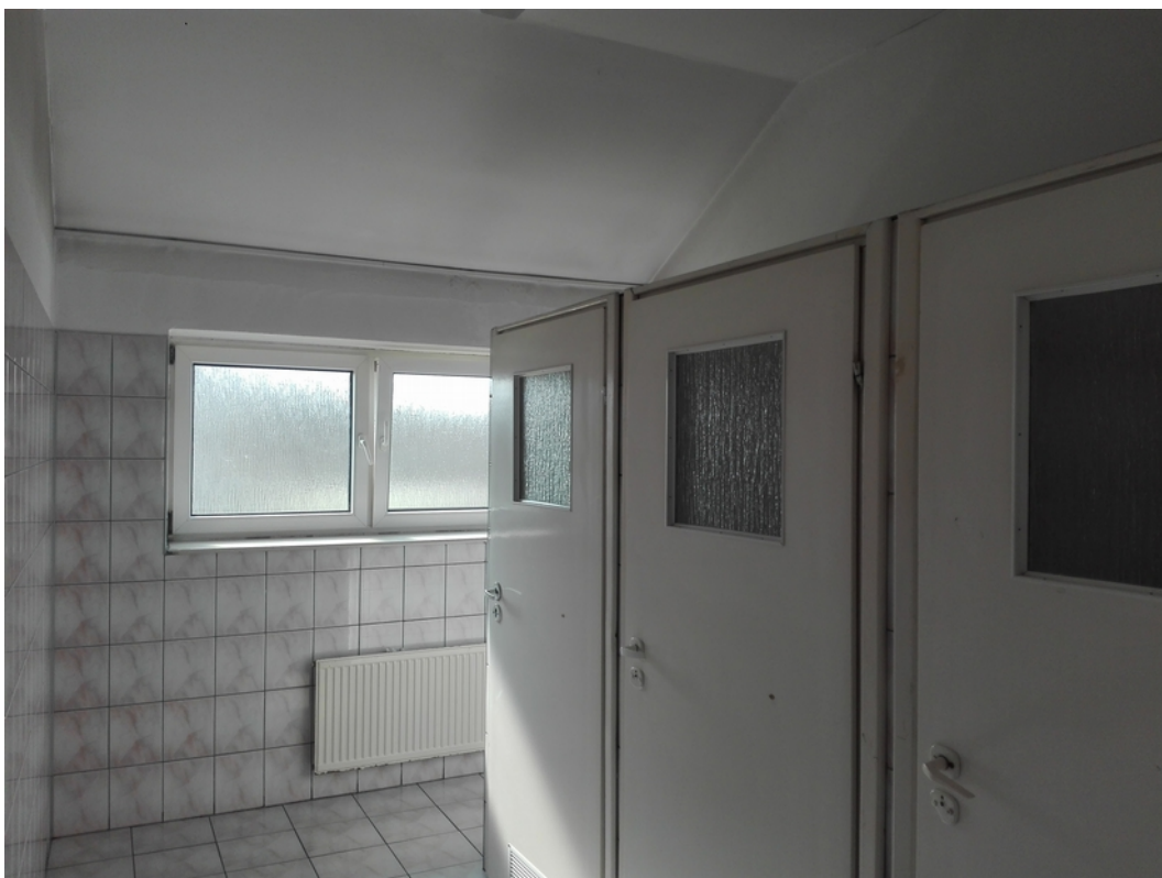
20. toalety damskie