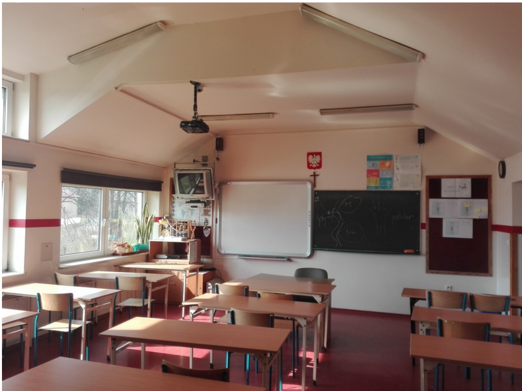
21. sala lekcyjna 5