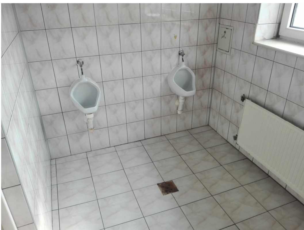
19. toalety męskie