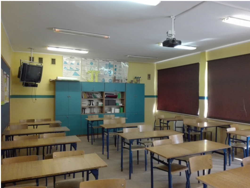
13. sala lekcyjna 2