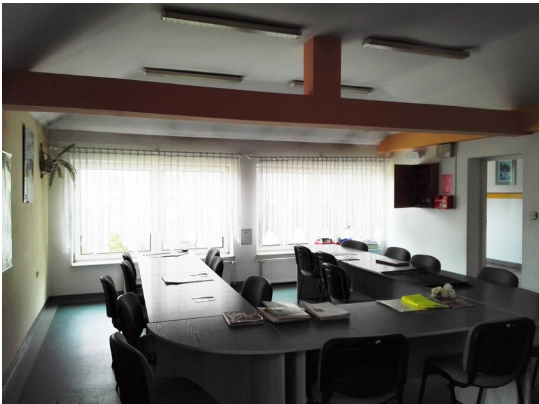
15. pokój nauczycielski