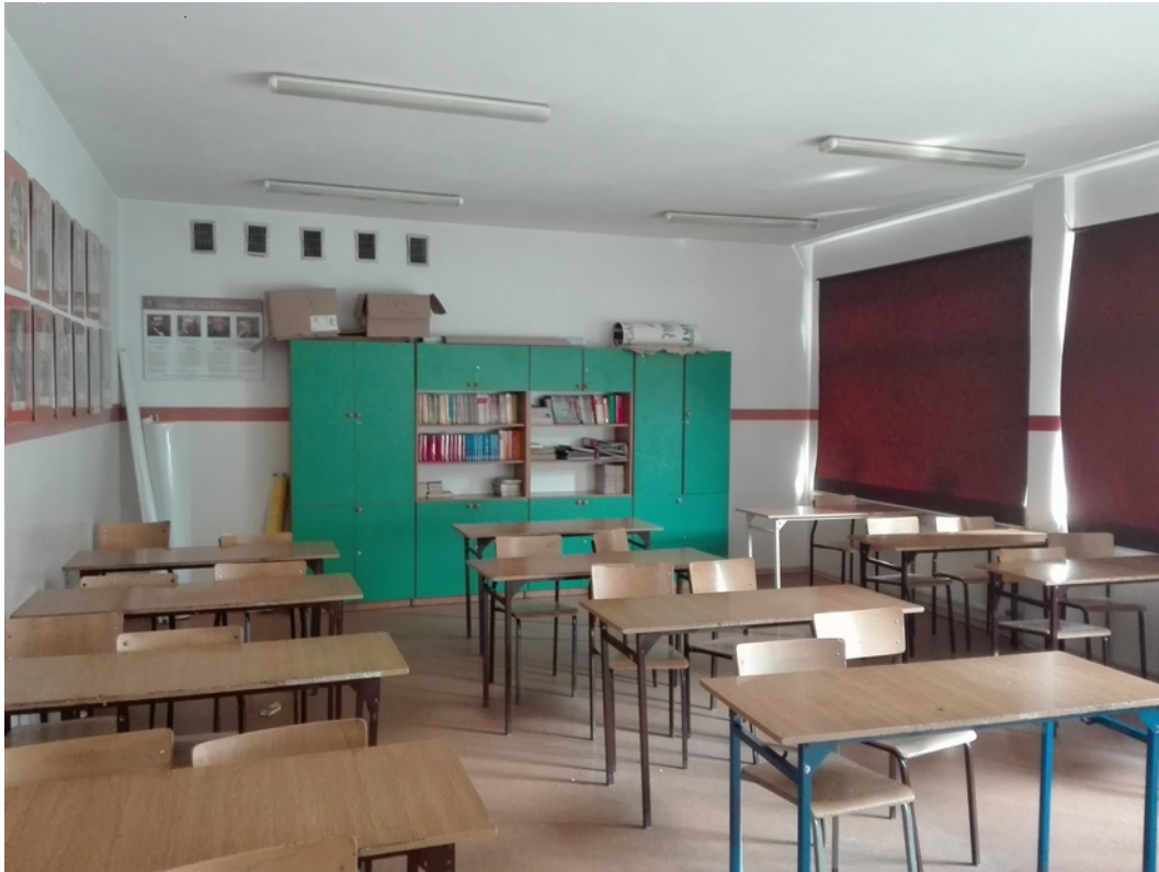
12. sala lekcyjna 1