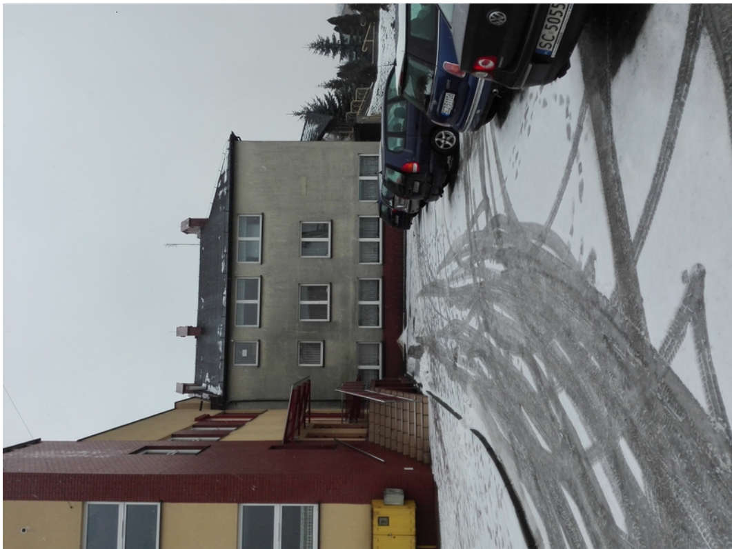
Inwentaryzacja stanu istniejącego. Dokumentacja fotograficzna. Luty/kwiecień 2019 Utworzenie oddziału przedszkolnego w budynku szkoły podstawowej w Koloni Poczesna, gm. Poczesna