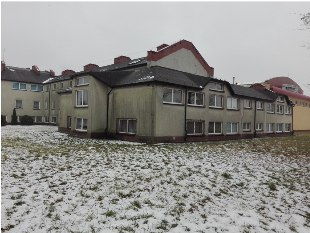
Inwentaryzacja stanu istniejącego. Dokumentacja fotograficzna. Luty/kwiecień 2019 Utworzenie oddziału przedszkolnego w budynku szkoły podstawowej w Koloni Poczesna, gm. Poczesna