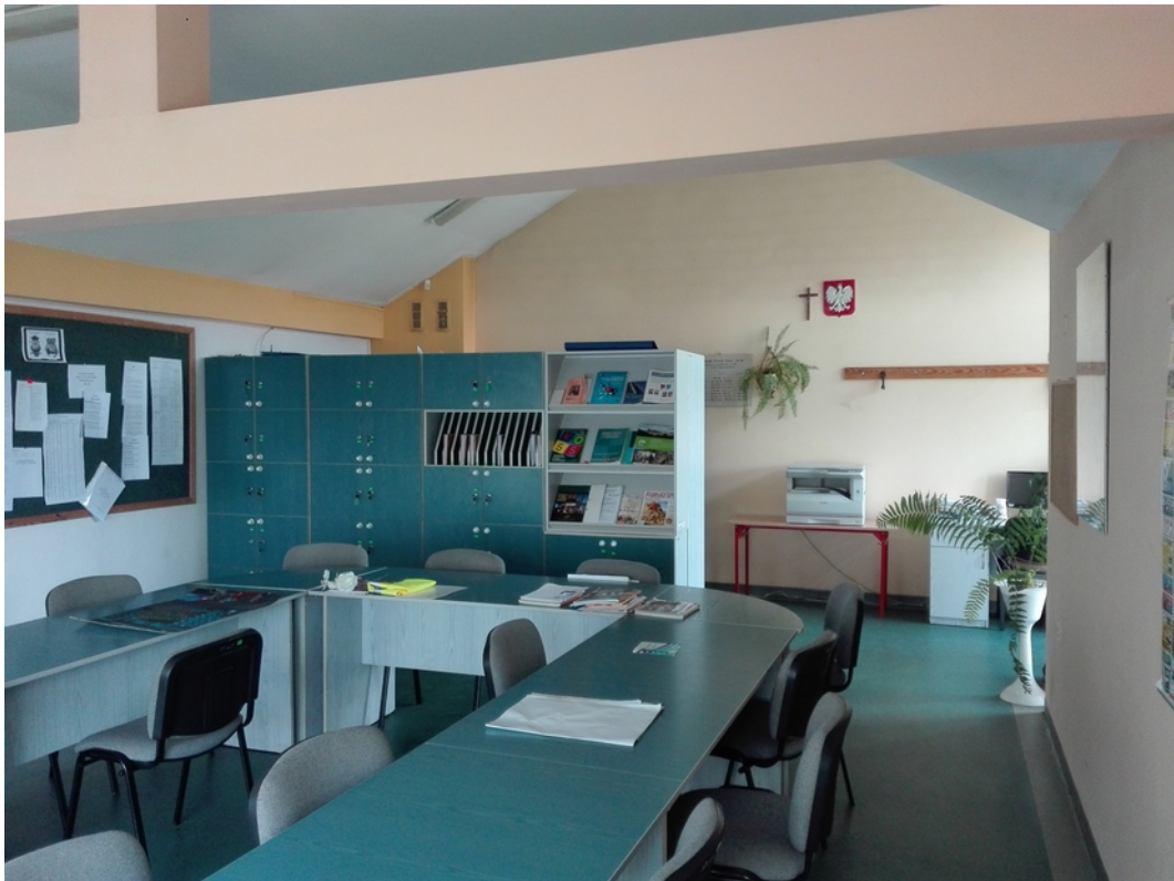
15. pokój nauczycielski