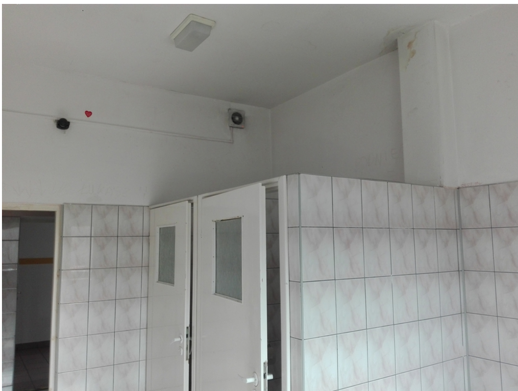
19. toalety męskie