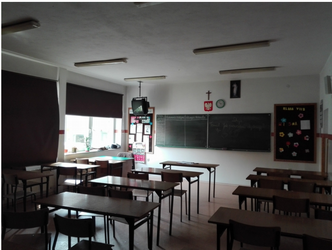
12. sala lekcyjna 1