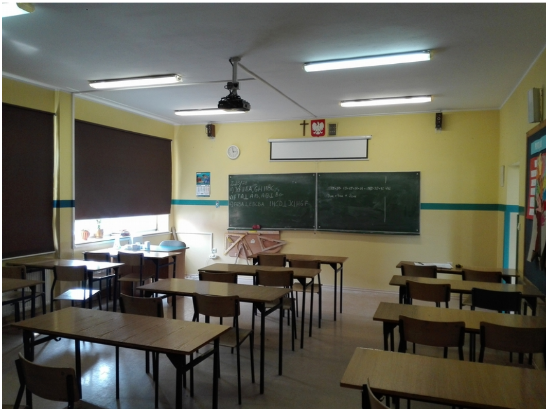
13. sala lekcyjna 2