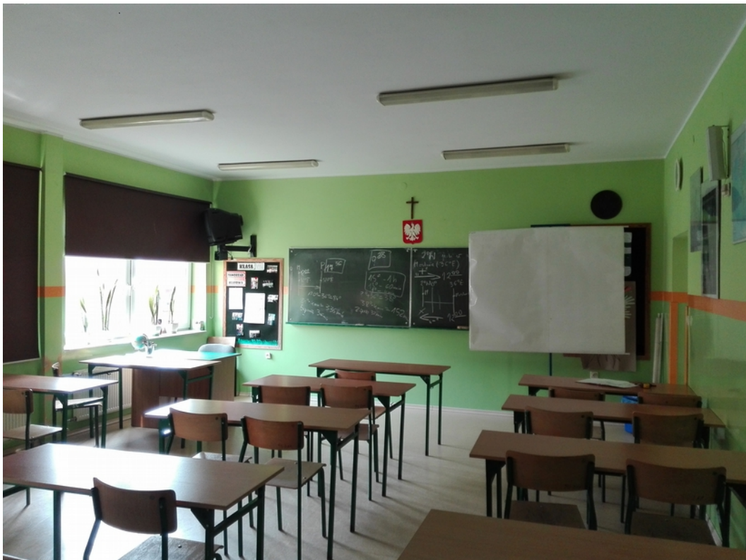
14. sala lekcyjna 3