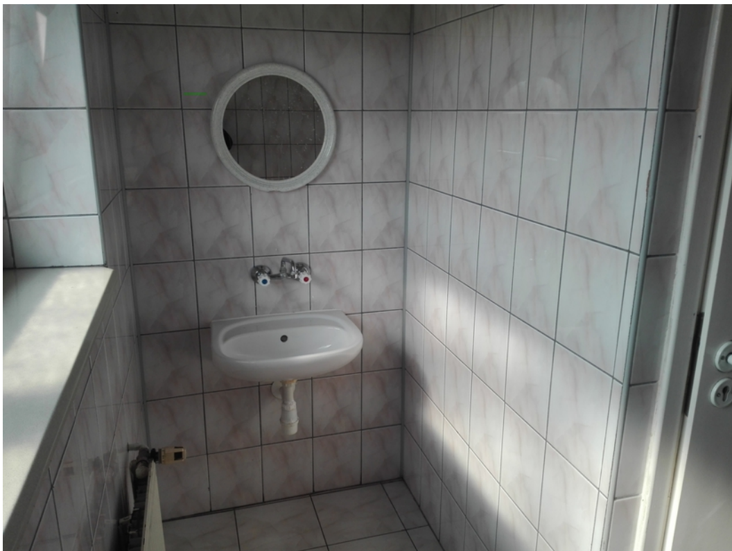
20. toalety damskie