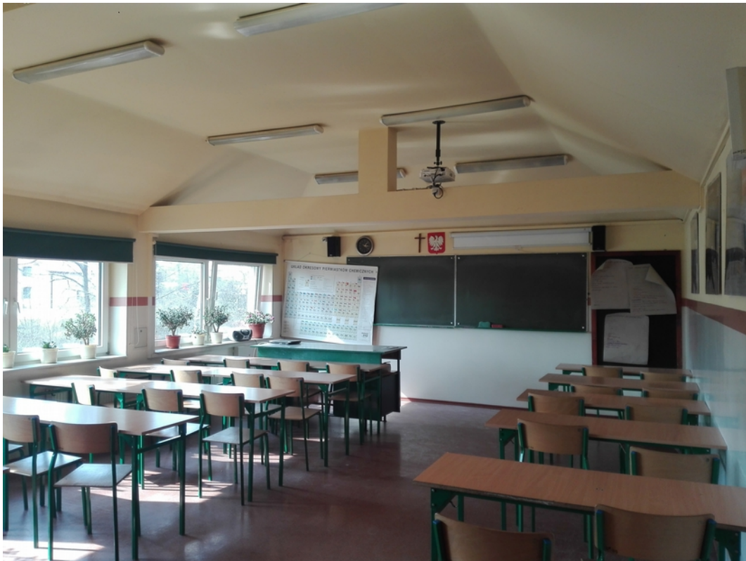
16. sala lekcyjna 4