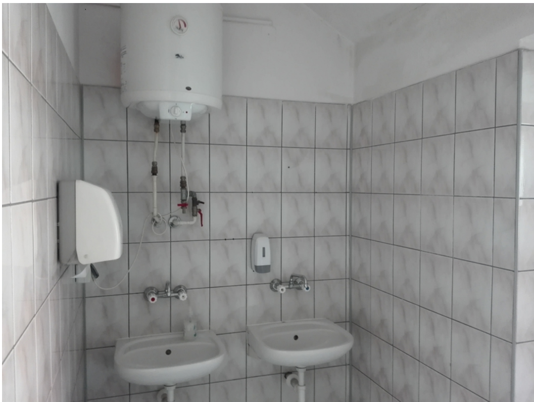
20. toalety damskie