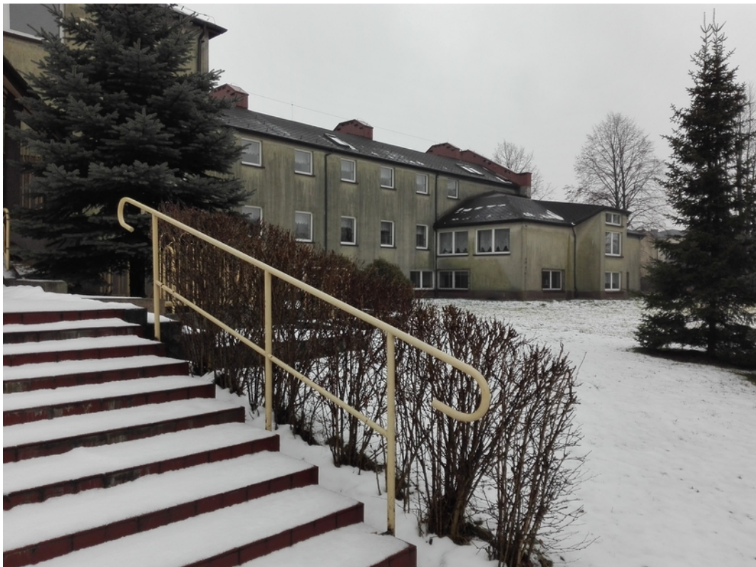
Inwentaryzacja stanu istniejącego. Dokumentacja fotograficzna. Luty/kwiecień 2019 Utworzenie oddziału przedszkolnego w budynku szkoły podstawowej w Koloni Poczesna, gm. Poczesna