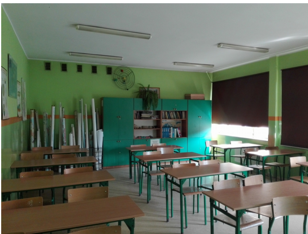
14. sala lekcyjna 3