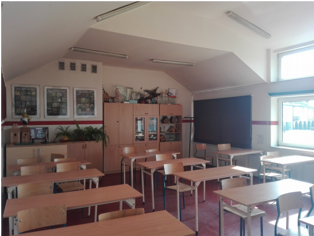
21. sala lekcyjna 5