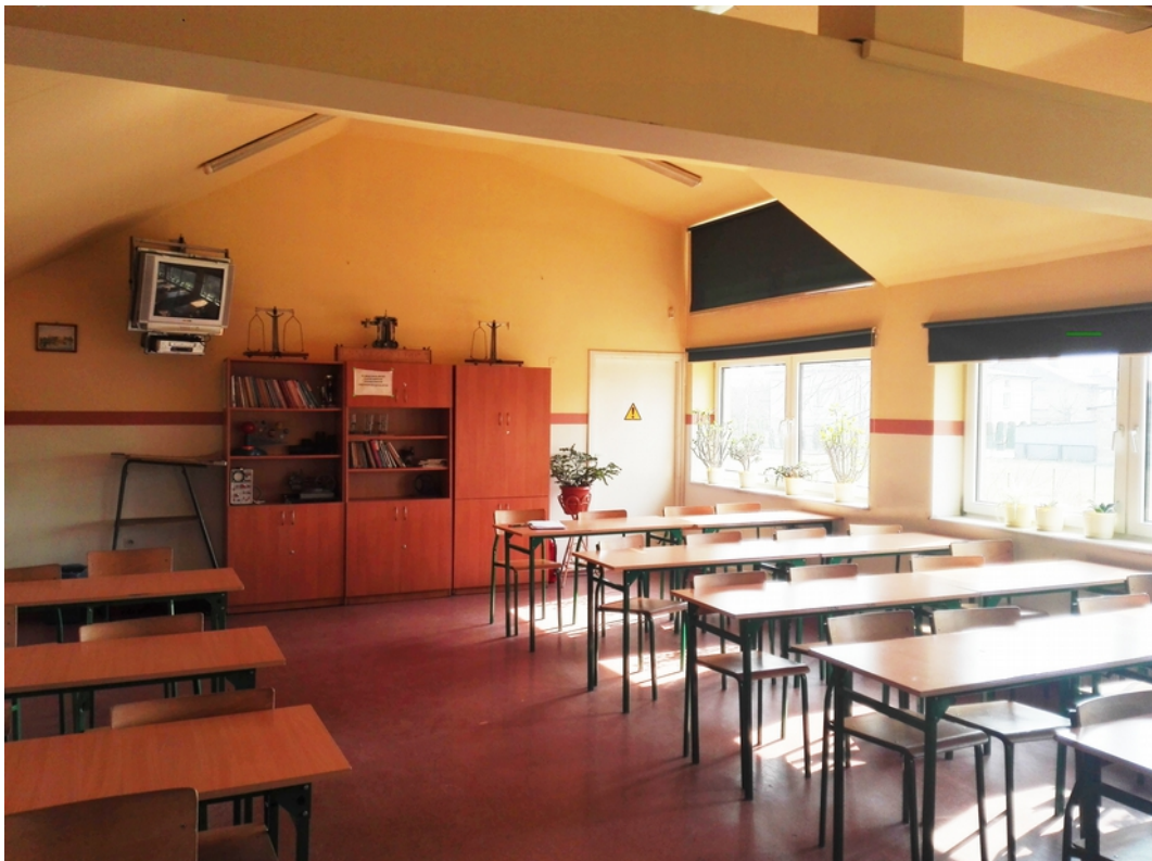
16. sala lekcyjna 4