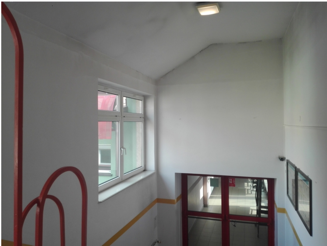
22. klatka schodowa