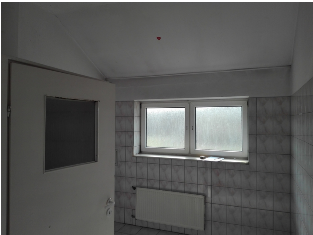
19. toalety męskie